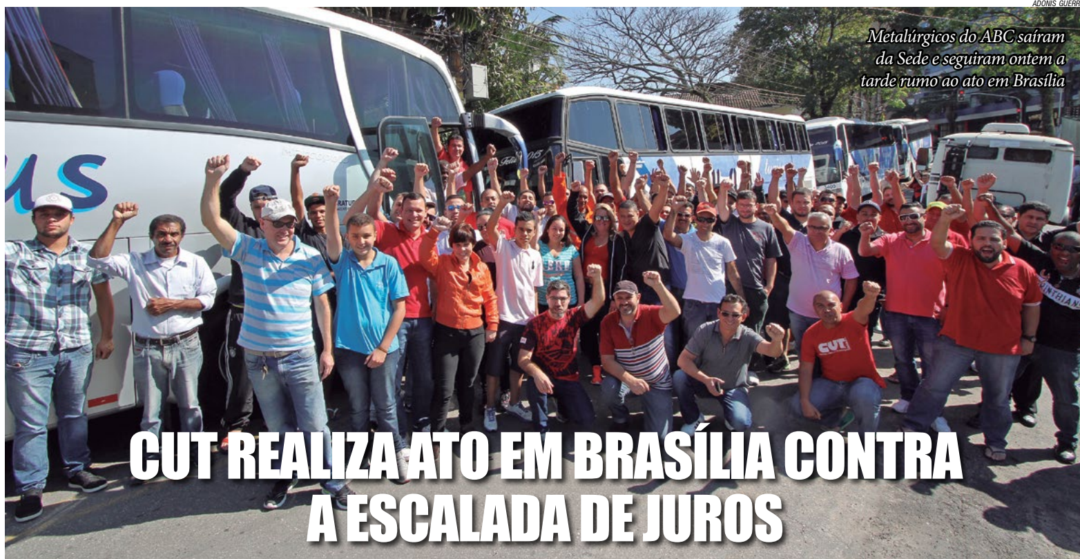
Metalúrgicos do ABC saíram da Sede e seguiram ontem a tarde rumo ao ato em Brasília

Crise da água elevou a inflação em São Paulo em até 10% no 1º semestre. Preços da água encaçada subiram 6,11% no mesmo período.